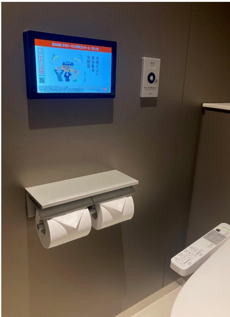
「オフィスでもサラ川」のイメージ

仕事のモチベーションに影響する場所として、「トイレ・化粧室」(66%)が1位となりました。2位の「食堂・カフェテリア」(46%)を20p以上離し、ワーカーにとって「トイレ・化粧室」が重要な役割を果たしており、心のリチャージの場所としての「トイレ・化粧室」の側面がうかがえます。